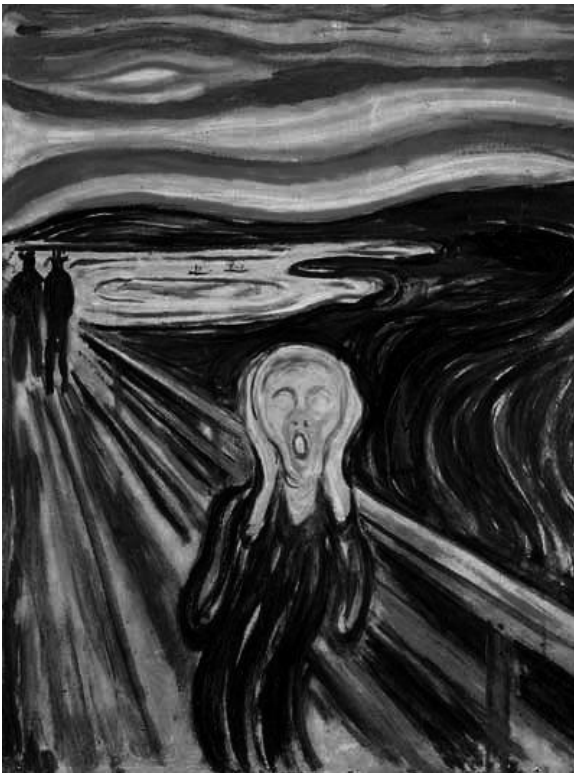
Εικόνα 1. "Η Κραυγή" του Ε. Μουνχ, 1893

[απόσπασμα από ποίημα του Ανδρέα Εμπειρίκου]